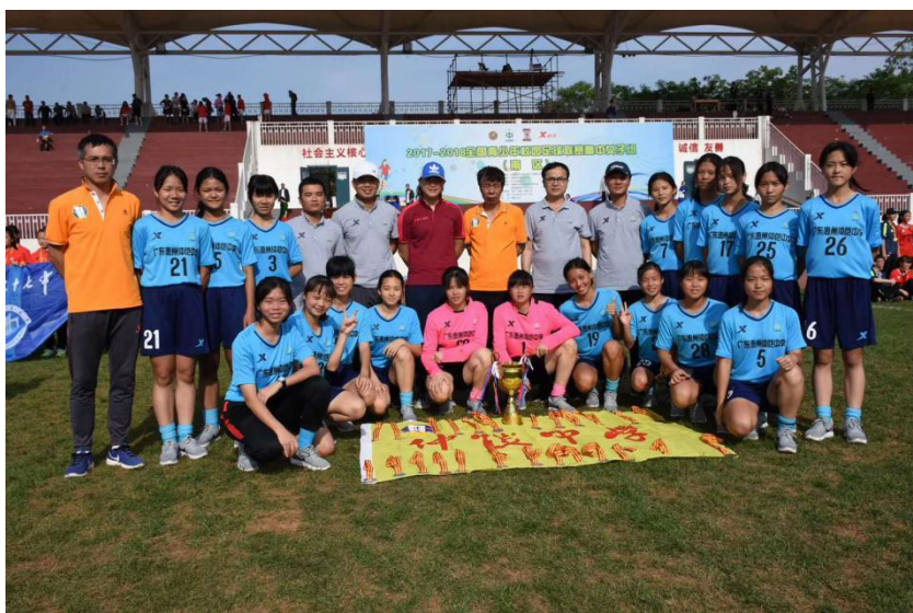
荣获 2017-2018 全国青少年校园足球联赛（南区）亚军