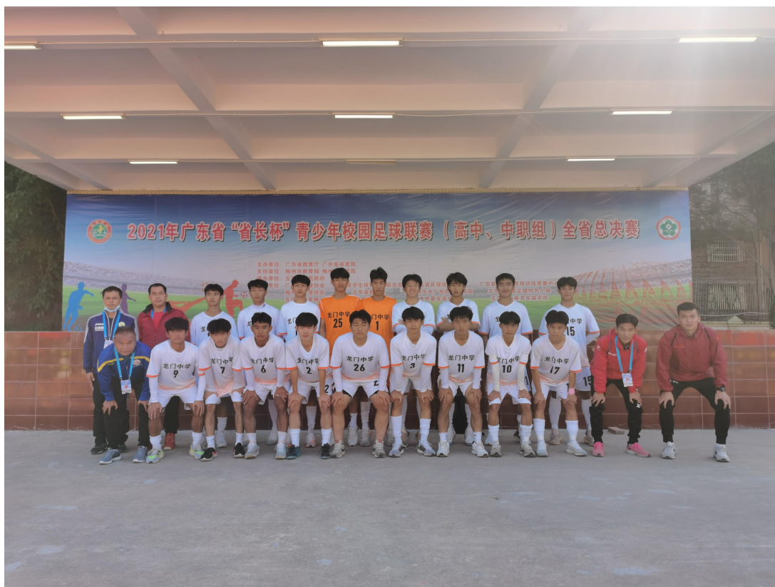
2021年省长杯足球赛后合影