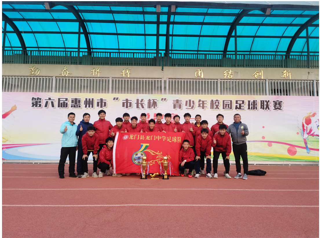
惠州市第六届市长杯男子足球队卫冕后合影