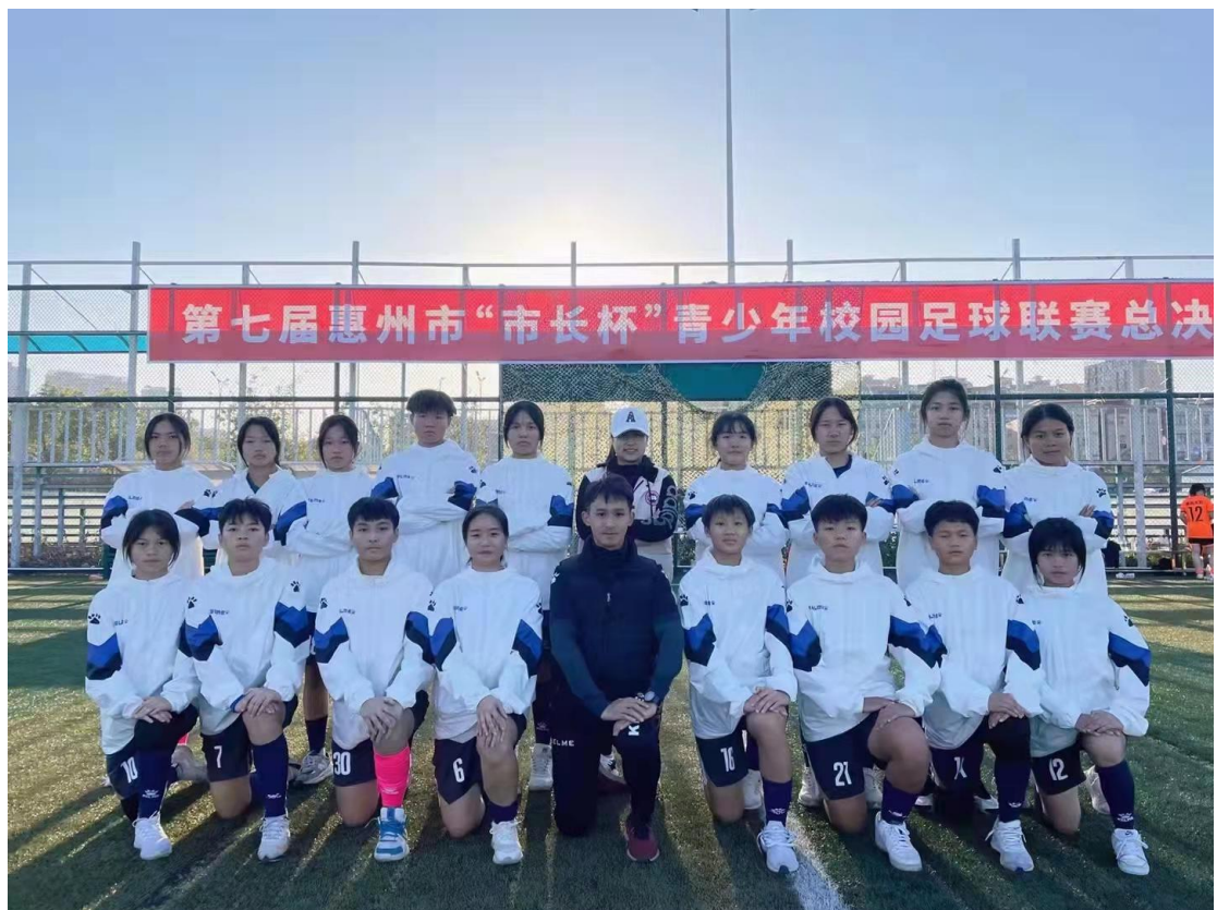
2021年惠州市第七届市长杯女子足球队赛后合影